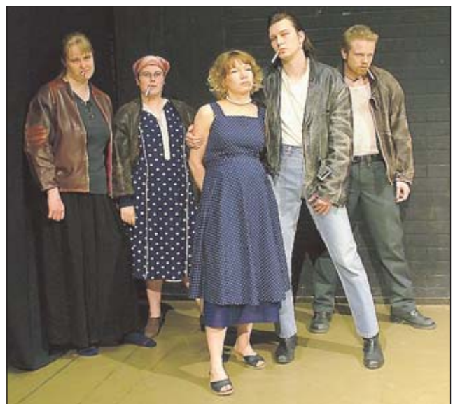
Paha suku. Uskaltaisitko hyppiä näiden silmille? Legioonateatterissa runonäytelmään saapastelevat myös kovat kundit.

Jos ideologiaa on, se voi olla vaikka laulettua. Ensi lauantain euroviisukisa Kiovaan on suomalaisille kitkerää huumorihömpää, mutta joillekin ukrainalaisille se saattaa olla tosvapauden virsikokoelma, laulusarja eurooppalaisuudesta. Iskelmäkin voi olla poliittista.